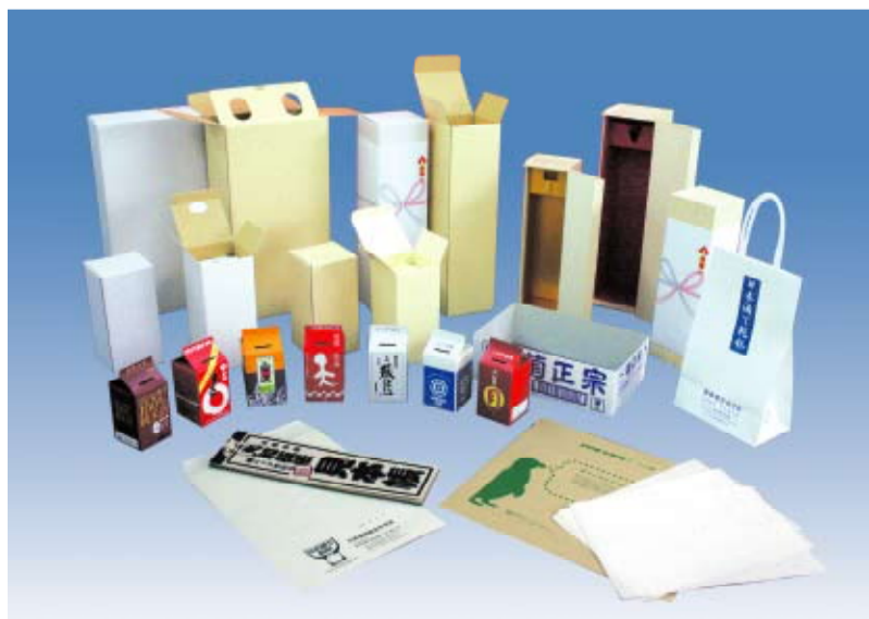
様々な酒パック再生品