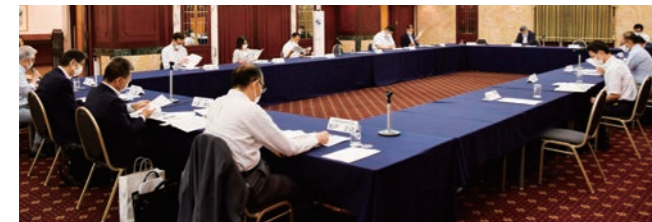
第39回情報交流会「大阪会議」

トン、伏見地区42トンであり統一的な回収システムがスタートして12年で、累積1,494トンがリサイクルされたこととなる。ただ灘地区での再生品利用を見ても、レギュラー的に製作されていた天パットが、最盛期の41品目から今年度は12品目と大幅に減少しており、今後いかに再生品活用を拡大できるかが循環システム維持の課題となる。